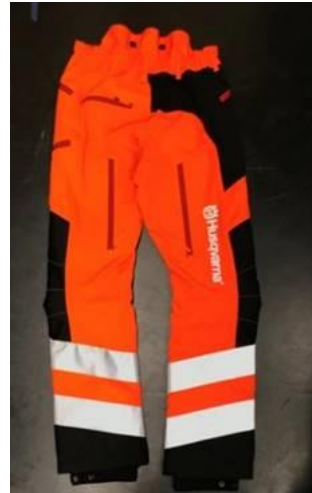
Technical High-Viz Brushcutting and Trimmer Trousers #74 back