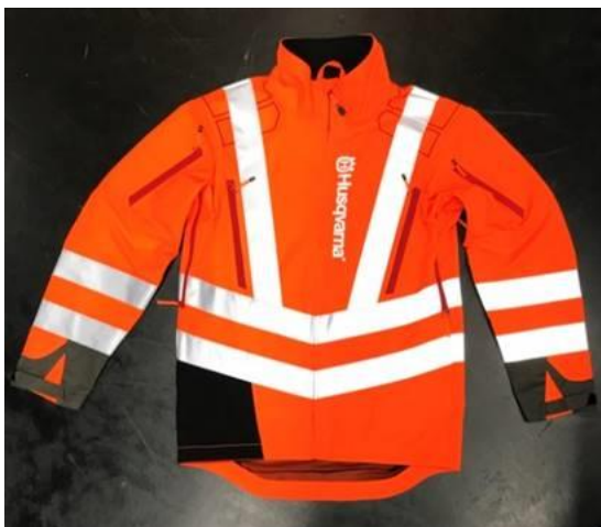
Technical High-Viz Brushcutting and Trimmer Jacket #73 front