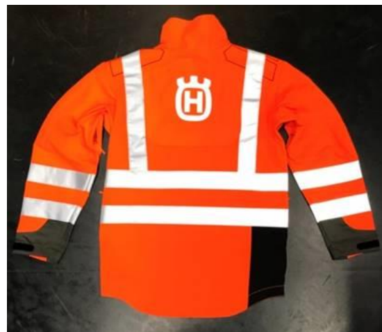
Technical High-Viz Brushcutting and Trimmer Jacket #73 back