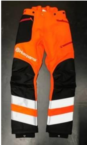
Technical High-Viz Brushcutting and Trimmer Trousers #74 front