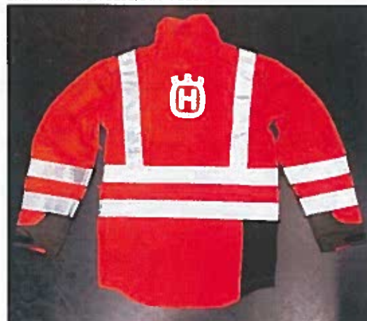
Technical High-Viz Brushcutting and Trimmer Jacket #73 back