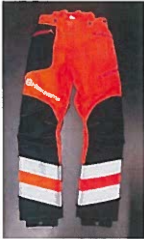
Technical High-Viz Brushcutting and Trimmer Trousers #74 front