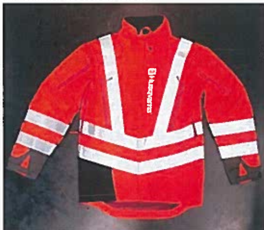
Technical High-Viz Brushcutting and Trimmer Jacket #73 front